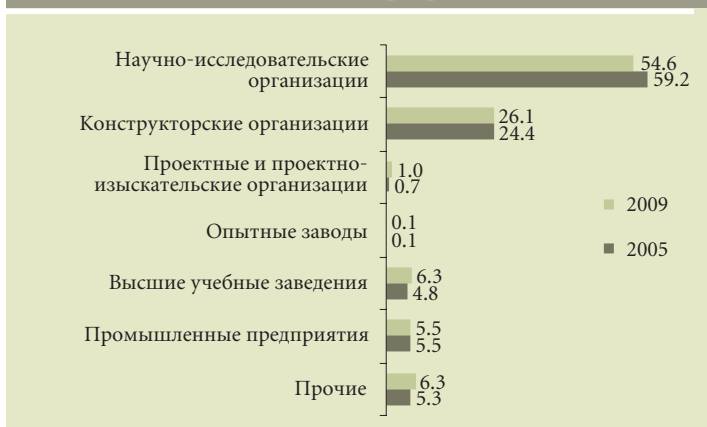
Структура внутренних затрат на исследования и разработки (%)