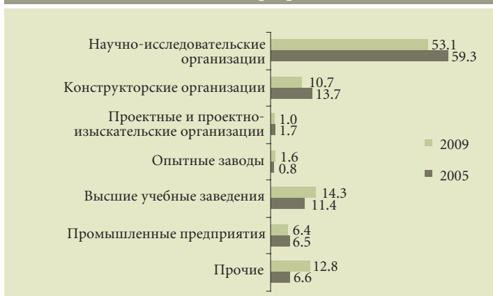
Структура организаций, выполняющих исследования и разработки (%)