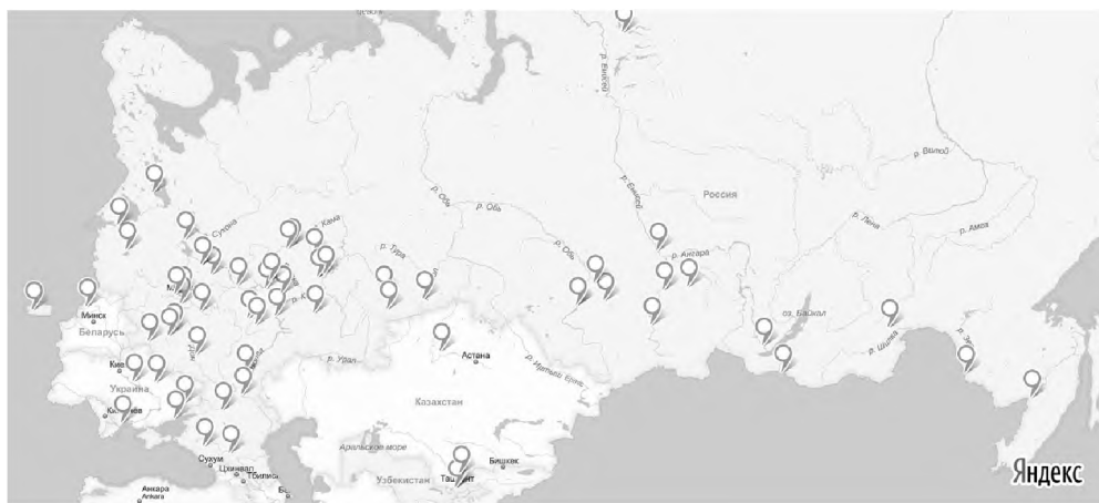
Населенные пункты, где жили в детстве участники 1-го этапа исследования